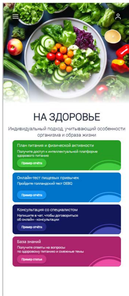
Рисунок 2 – Главная страница приложения